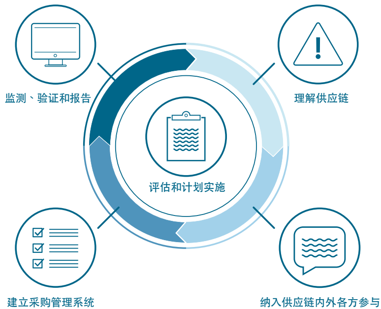
图1 – 提倡环境和社会可持续性的牛肉采购的五要素方法