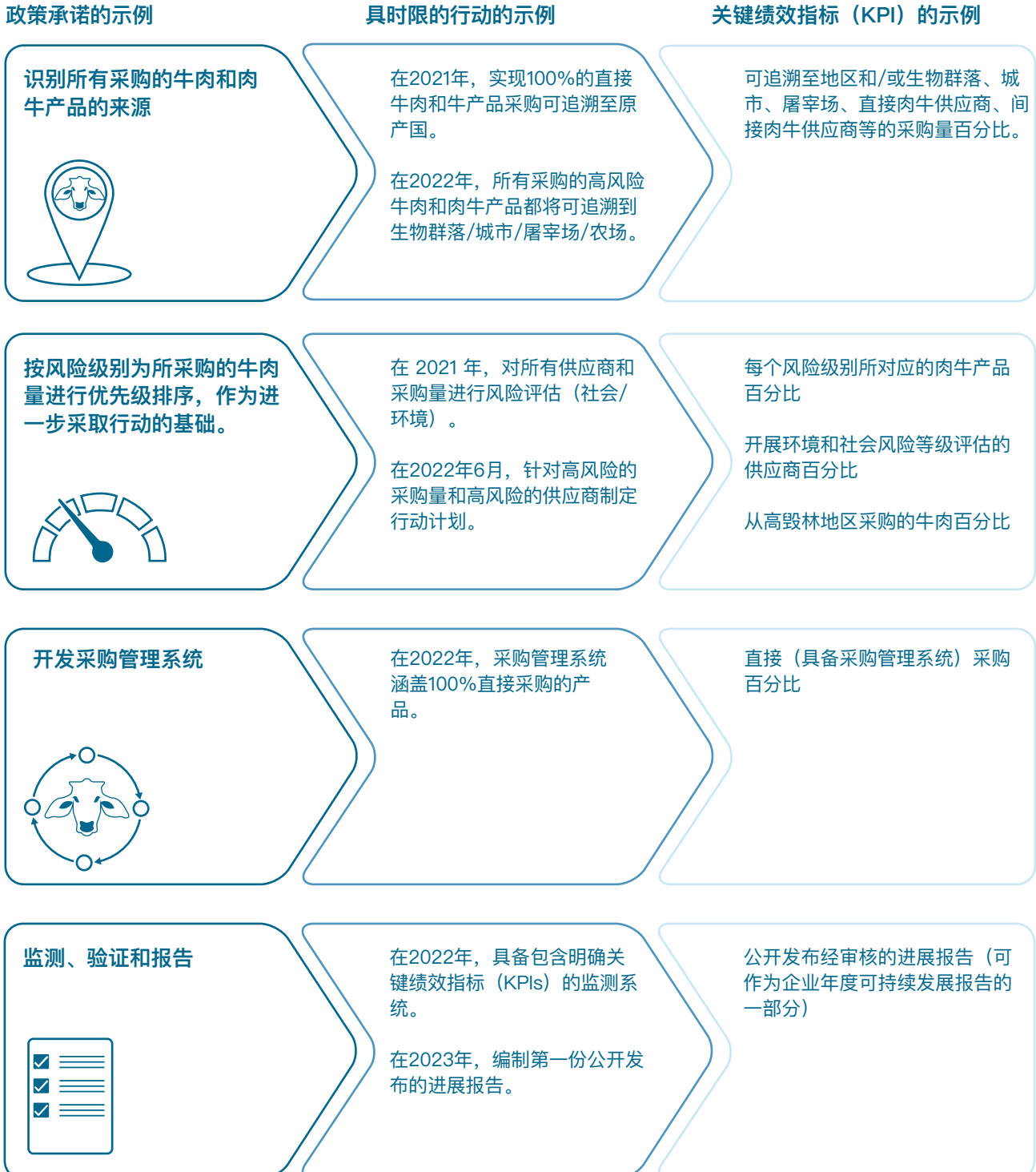
表1:含具时限行动的目标及相关关键绩效指标 (KPIs) 的示例

实施计划应包括明确的目标和强有力的里程碑，以促进逐步实现目标。里程碑必须是 SMART（具体的、可衡量的、可实现的、相关的和具时限的），并可用作监测和报告框架的基本结构。里程碑应该有明确的行动或与其相关的关键绩效指标（KPIs），以便定期衡量进度（见表 1）。